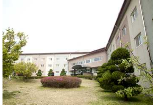
Cơ sở vật chất